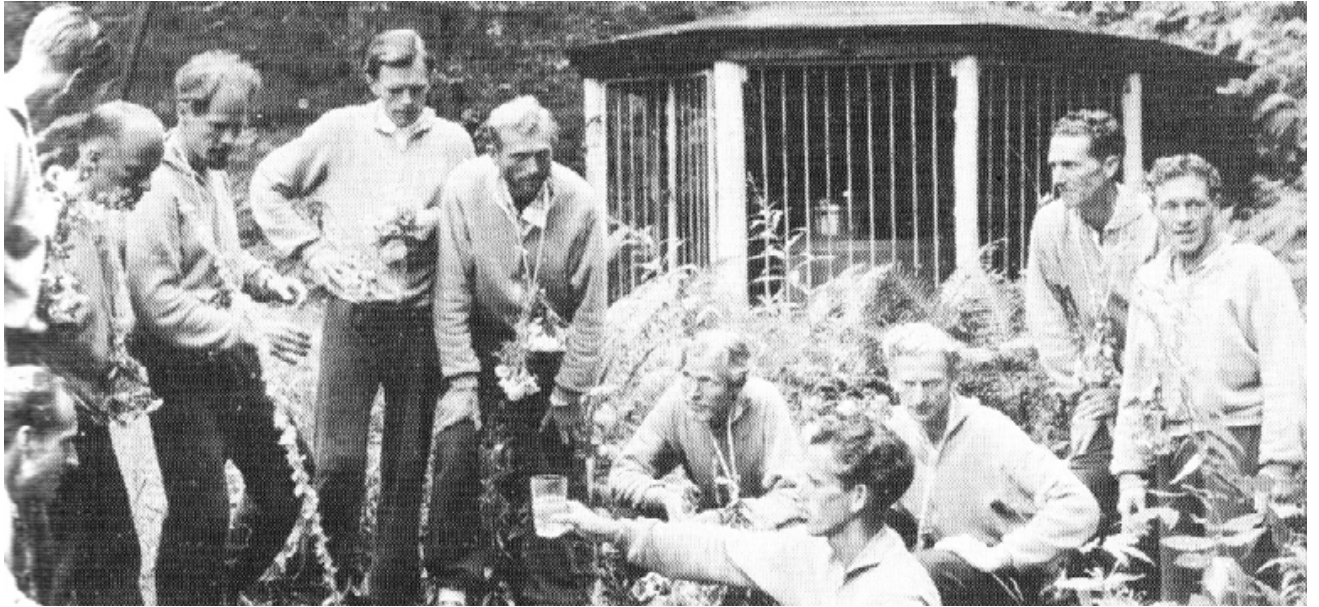
Les 11 participants lors de cette marche historique

avec 15 participants, tous pratiquant le jeûne de type Buchinger – jus de fruits, tisanes et bouillon de légumes. Le suivi médical journalier donna un rapport clinique étonnant : tous les participants furent en meilleure santé à la fin de cette marche. Ce rapport faisait du bruit dans la presse médicale et paramédicale.